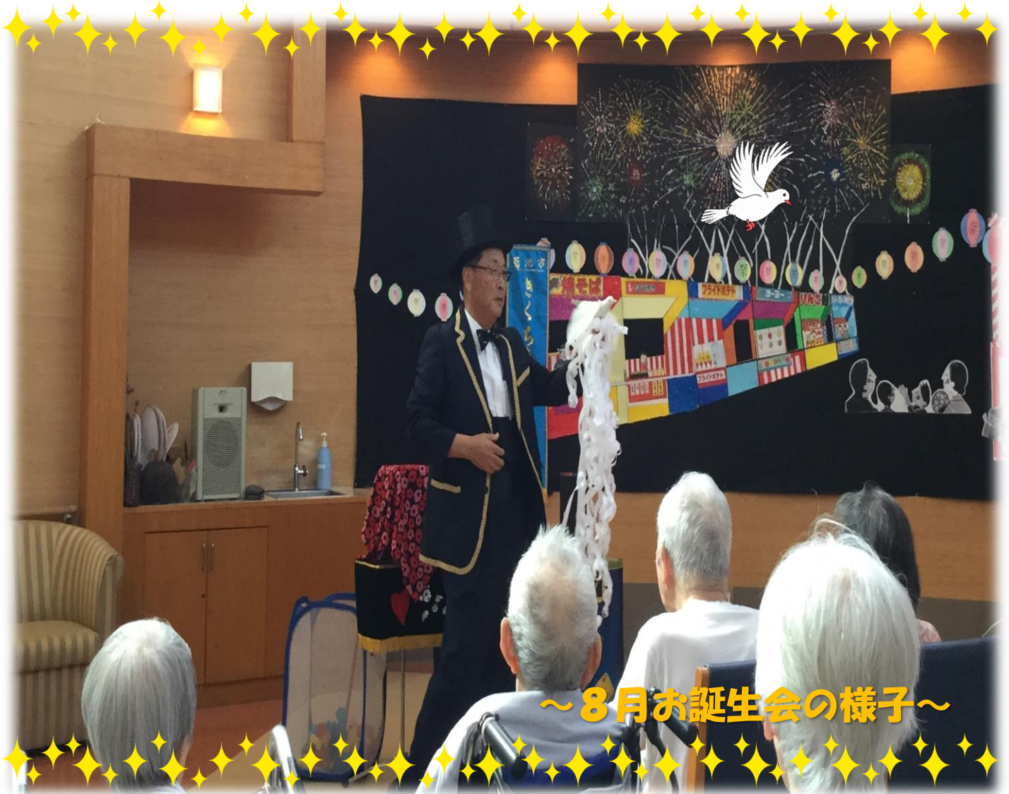
～8月お誕生会の様子～

・介護老人保健施設 孔子の里 菊池市泗水町福本904-1 TEL0968(38)5666